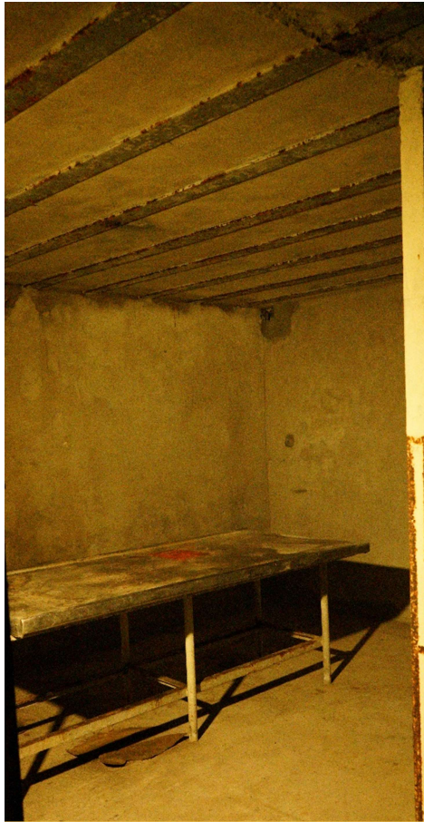
Bild 18. I det som var Officersmäss står idag ett bord gjort i rostfri plåt som kan ha använts som arbetsbord vid vapenvård, matlagning eller annan sysselsättning. Underofficersmässen är idag helt utan innehåll vid besöket.